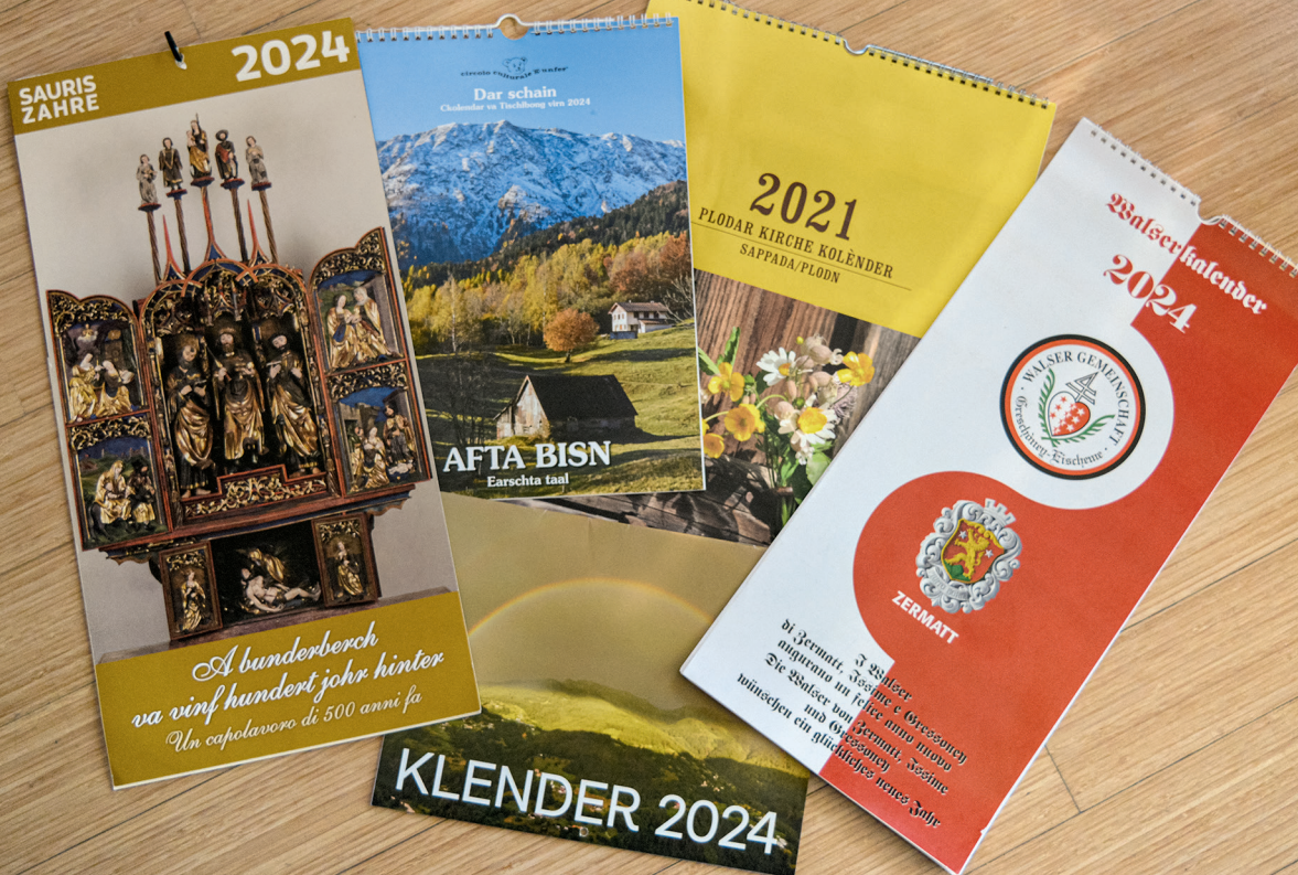
Kalenderdeckblätter aus deutschen Sprachinseln in Oberitalien